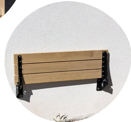
Bankje Jordaan (opklapbaar)